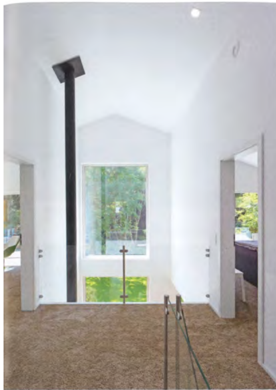
Eine Galerie mit Glasbrüstung verbindet die beiden Wohnebenen und bringt Tageslicht in den Flur.

Einsatz und das Haus erreicht Effizienzhaus-40-Standard.