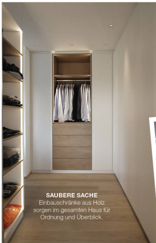
SAUBERE SACHE Einbauschränke aus Holz sorgen im gesamten Haus für Ordnung und Überblick.