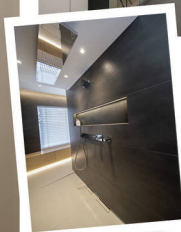
WELLNESS Großer Duschbereich, gläserne Sauna und Möbel aus Holz: Das Bad lässt keine Wünsche offen.