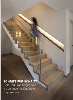
SCHRITT FÜR SCHRITT Holz und Glas zeigen sich als gelungenes Duo beim Treppenbau.